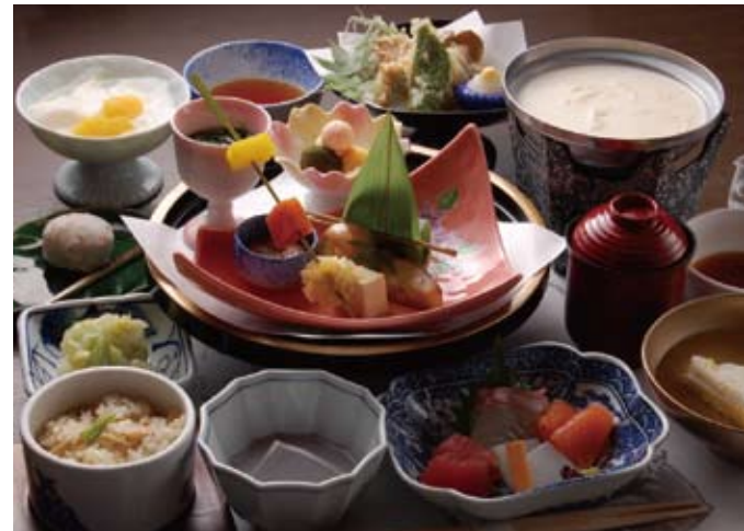
品数豊富な京懐石を心ゆくまで堪能しよう

☎075-223-3456 京都市中京区木屋町通二条下ル東生洲町484-6 営 / 11:00~22:00 (21:30LO) 休 / 無休 P / 無 HP→Simple HPよりリンク