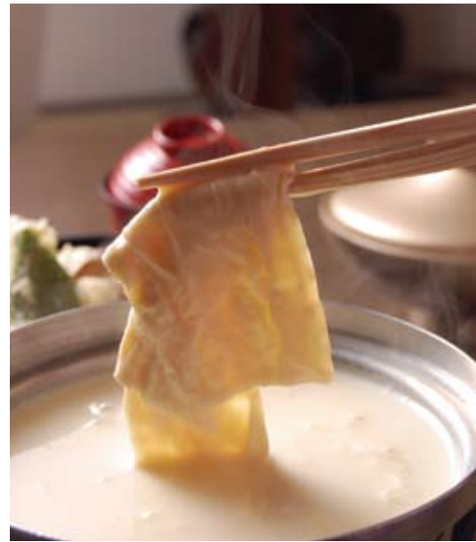
コースの一部、豆乳ゆば鍋はできたての湯葉が味わえる