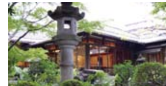
秋は紅く色付いた景色も楽しみのひとつだ