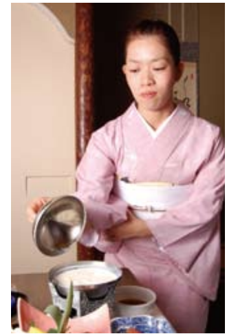
和服のスタッフが出迎えてくれる