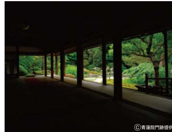
華頂殿からは素晴らしい額縁景色が眺める