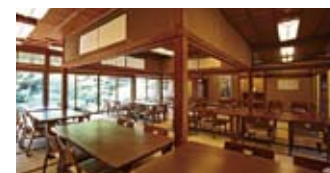
趣のある寛げる空間で料理を味わう