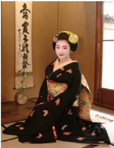
ツアーでは特別に舞妓さんとの時間も予定している