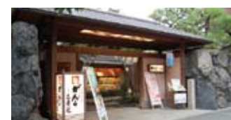
高い石垣に囲まれた入口