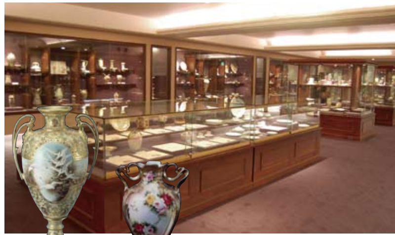
歴史的、文化的価値の高いオールドノリタケを展示。世界を魅了したノリタケの美の世界が広がる