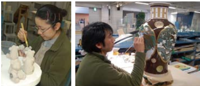
実際に職人たちが作品を作り上げる様子を間近で見学できる