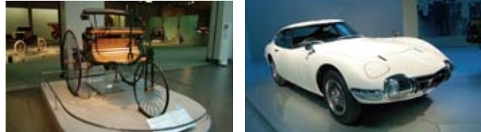
ベンツ パテント モーターヴァーゲン 1886年に誕生したガソリン自動車第1号。時速15kmの走行が可能 トヨタ2000GT 1967年に登場した高性能な国産スポーツカー。3つの世界記録と13の国際新記録を樹立した