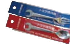
「オリジナルスパナスプーン・フォーク」各420円 スパナをかたどったスプーンとフォーク