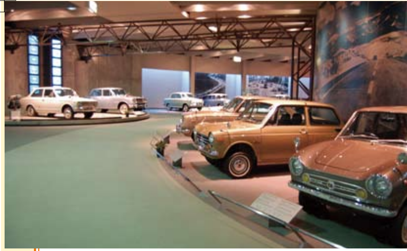
館内には様々な車が展示されている。現在も定期的に点検を行っており走行が可能