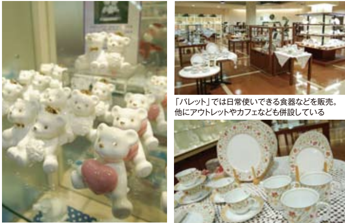
陶器の子熊は人気のアイテム