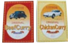
「オリジナルカレー全6種類」各380円 本格的な味わいの人気のカレー