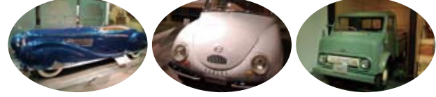
ドラージュ スバル360 トヨタエース