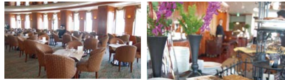
広々とした寛ぎの空間で贅沢なひとときを過ごしたい