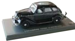
「オリジナルミニカー」3,150円 1/43スケールのトヨタAA型自動車