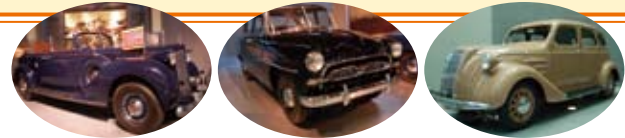
バックードウエールプ (ルーズベルト大統領車) トヨタV8クラウン トヨタAA型乗用車