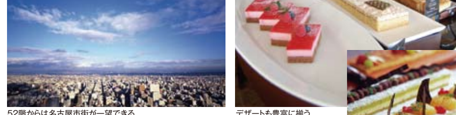
52階からは名古屋街が一望できる